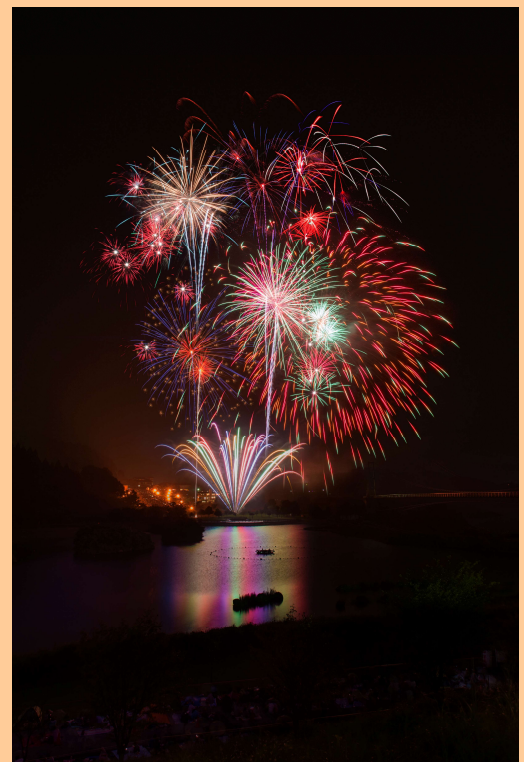
過去の花火大会開催の様子